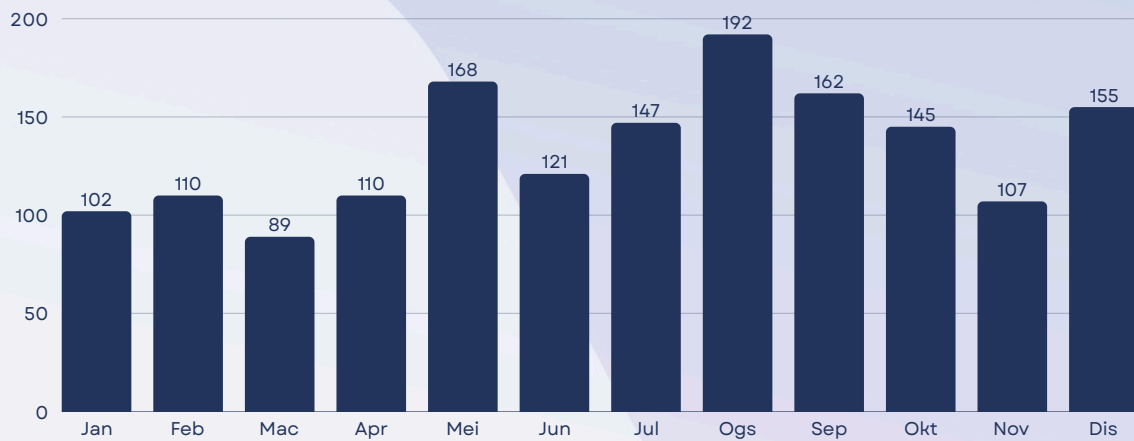
Tindakan Aduan Selesai Tahun 2024