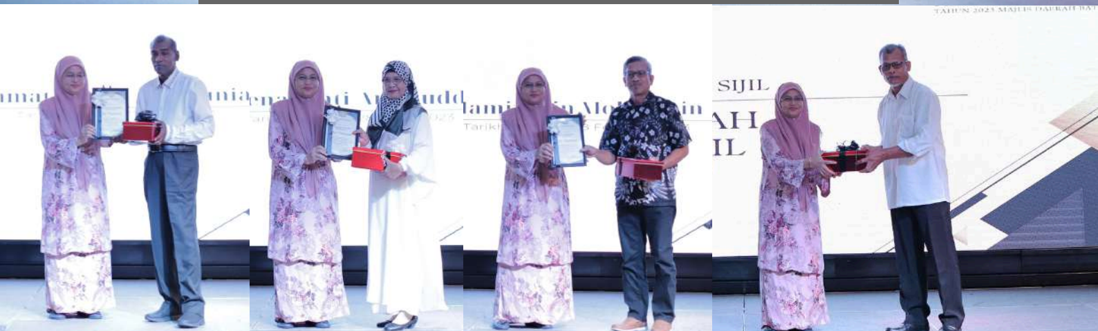
Penghargaan kepada pesara tahun 2023