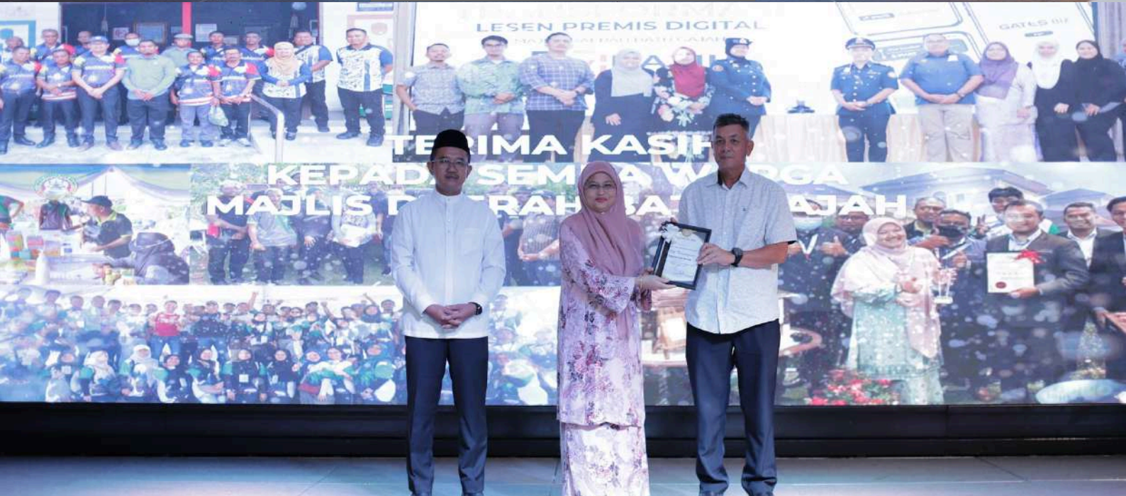
Tuan Setiausaha mewakili semua warga Majlis Daerah Batu Gajah, menerima Anugerah Yang Dipertua