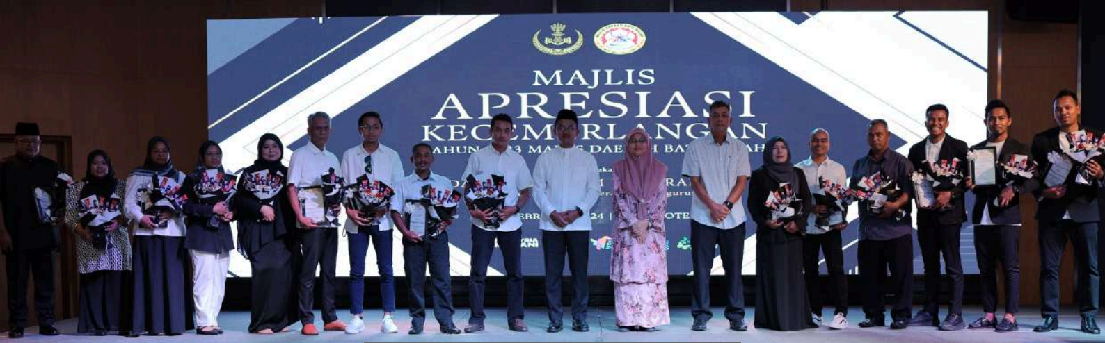
Barisan penerima Anugerah Perkhidmatan Cemerlang